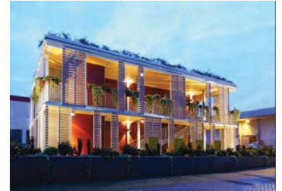
Designo srl _ Easy Building System