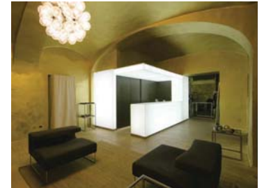
STUDIO 74 _ Before Jeans N Dress

Immagini in alta risoluzione presenti su: