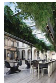
Nicolino & Ratti _ Ristorante Trussardi